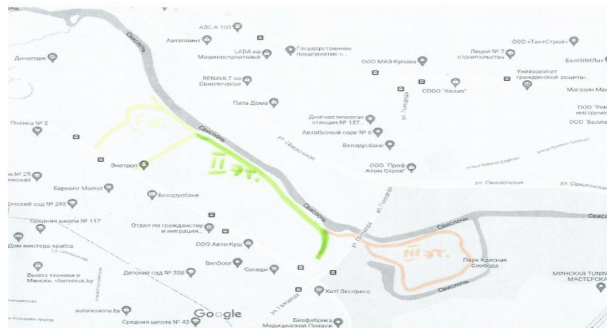
The layout of the stage III